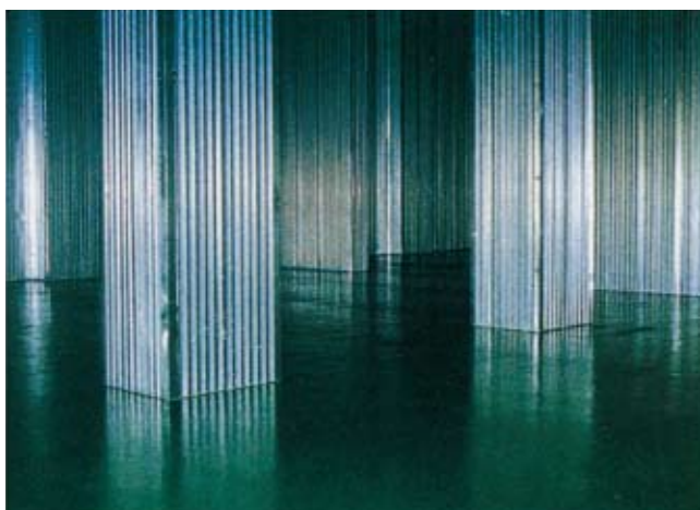
⑥仕上材を施して完成