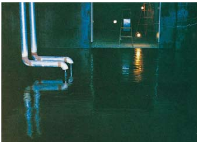
①プライマーを全面塗布