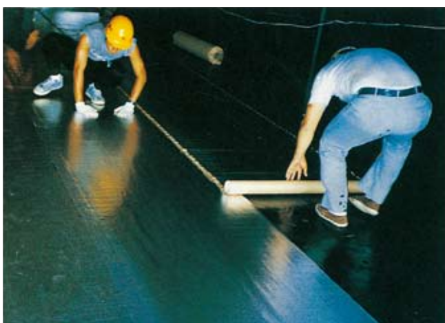
②底部にトライシートTR-10を敷設