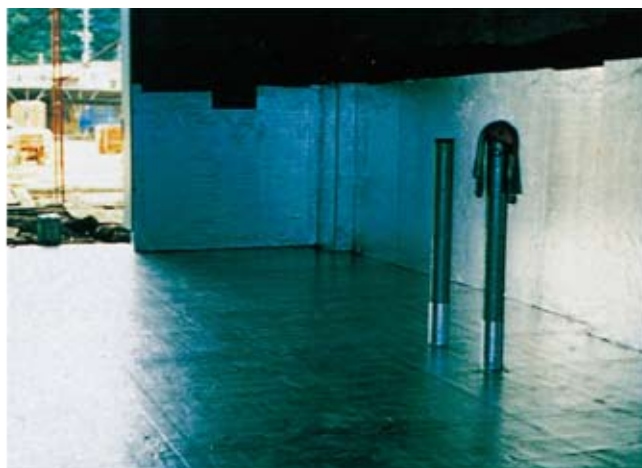
④トライシート底部、壁面施工完了