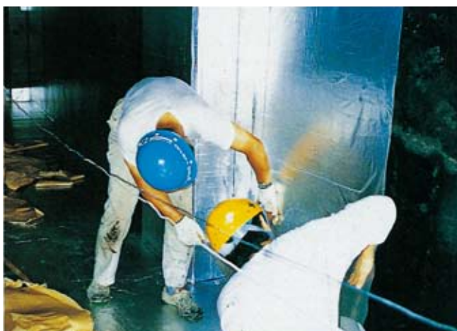
③壁面にトライシートTR-10を貼り付け